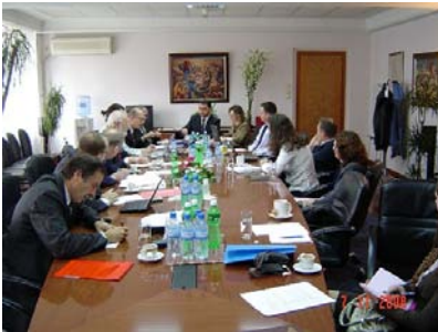
Das erste Treffen der Beratergruppe.