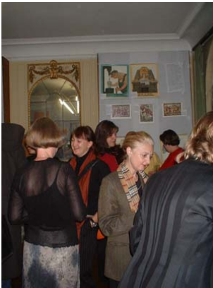
Vernissage einer Ausstellung sowjetischer Plakate in den ehemaligen Münchner Räumen des OEI (Archivfoto).